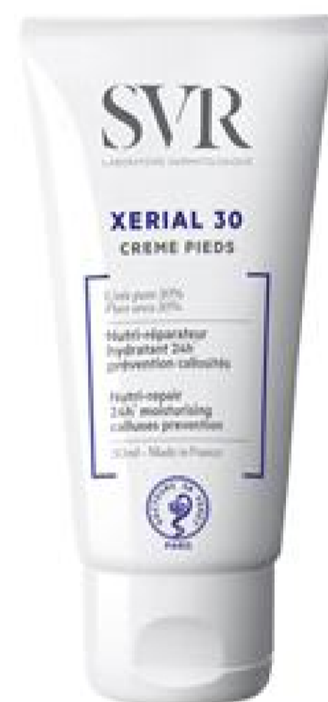
SVR Xerial 30 Creme Pieds