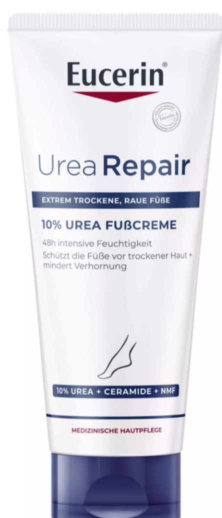
Eucerin UreaRepair PLUS Foot Cream 10%,

Сухая кожа стоп также подвержена заражению грибком. Подберите из нижеперечисленных средств и используйте для ежедневного увлажнения СРАЗУ после водных процедур: