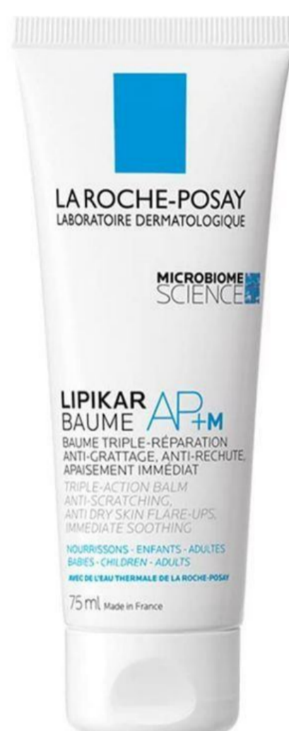
Lipikar Baume AP+M